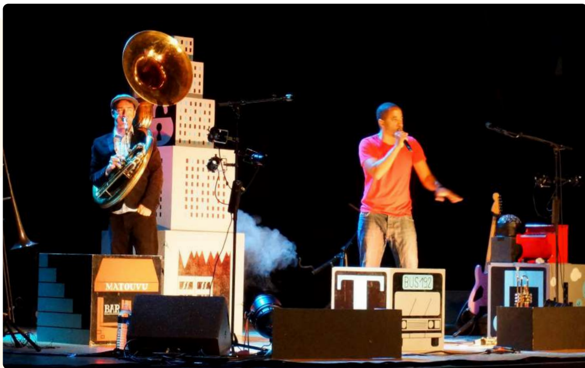
Décor de Panique au Bois Béton

Cette scénographie simple et astucieuse est le fruit d'échanges avec le constructeur Olivier Droux. Et le graphisme est réalisé par l'artiste Dino Voodoo.