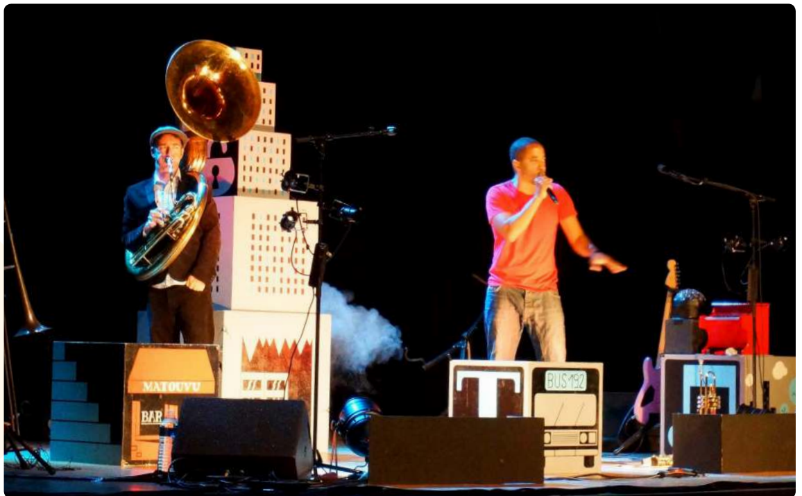
Décor de Panique au Bois Béton

L'envie est de construire un décor à partir d'un objet, tout comme Panique au Bois Béton avait ses cubes. Plusieurs pistes sont en cours de réflexion et seront affinées avec le commencement des résidences au plateau. Le duo imagine un décor qui serait modulable à vue et qui évoluerait au fur et à mesure du spectacle.