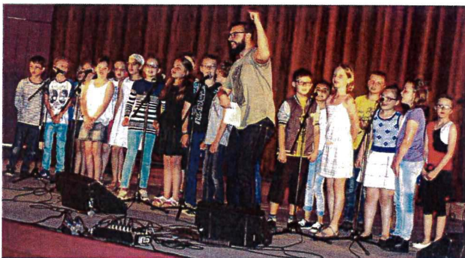
L'école Jean Moulin a le rap dans la peau.

L'école Jean Moulin du Neubourg, ses voisines d'Hondouville, Saint-Aubin-d'Écrosville, Crosville-la-Vieille et Bacquepuis et les « grands » du lycée agricole ont su s'imprégner de cette musique, tant au niveau des rythmes qu'à celui des paroles, pour nous offrir des refrains très entraînants. Les participants ont encore en tête les six lettres du mot « A.M.I.T.I.É. » scandées