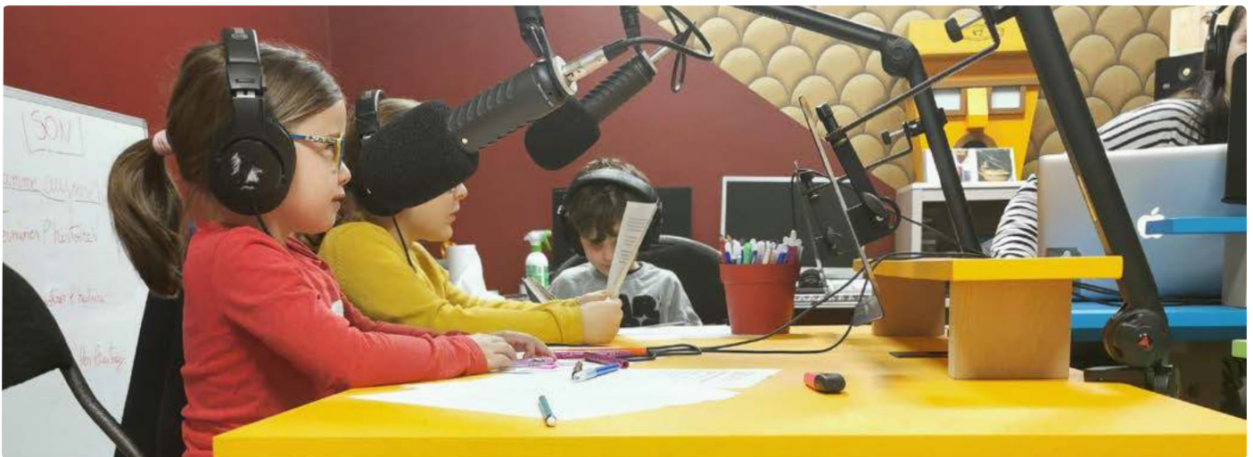
Le Club Radio - avril 2022