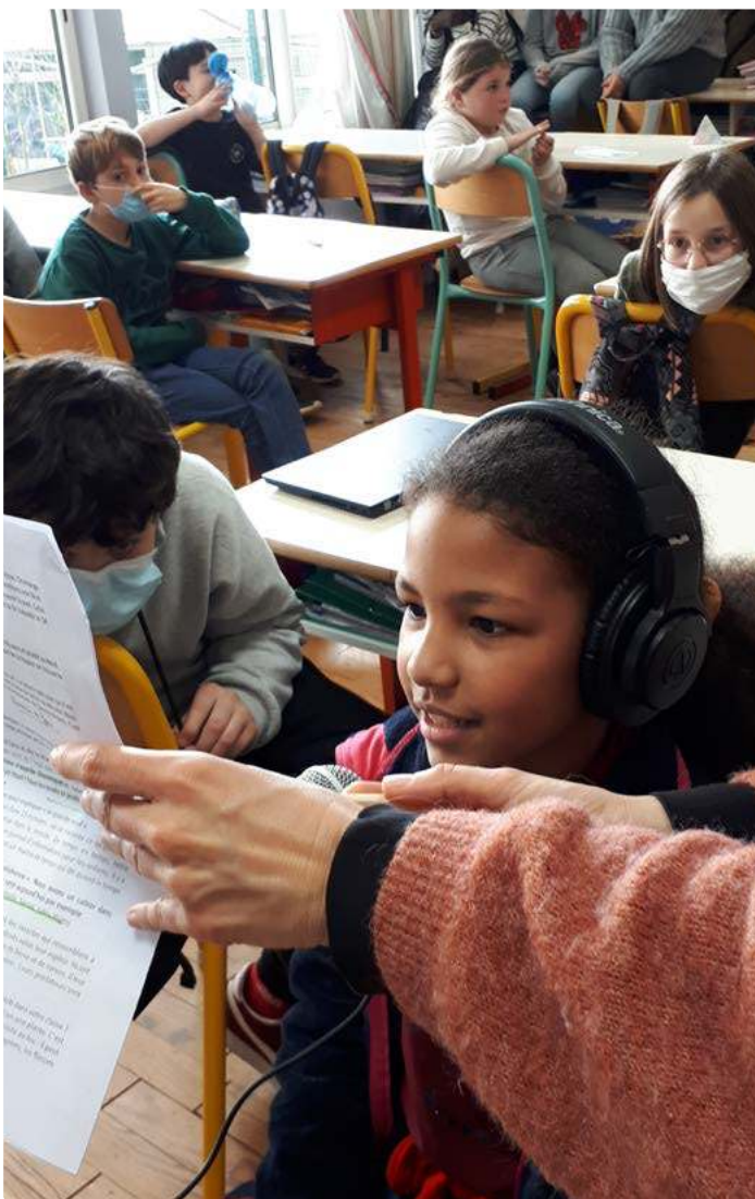
Correspondances sonores - 2022

Tout ceci permet aux jeunes de découvrir les coulisses de la création radiophonique, tant sur l'aspect technique (matériel et processus liés à l'enregistrement et au montage) que sur les contenus (réalisation d'interviews, créations de fictions sonores...) et de s'ouvrir sur le reste du monde dans des contextes différents du cadre scolaire.