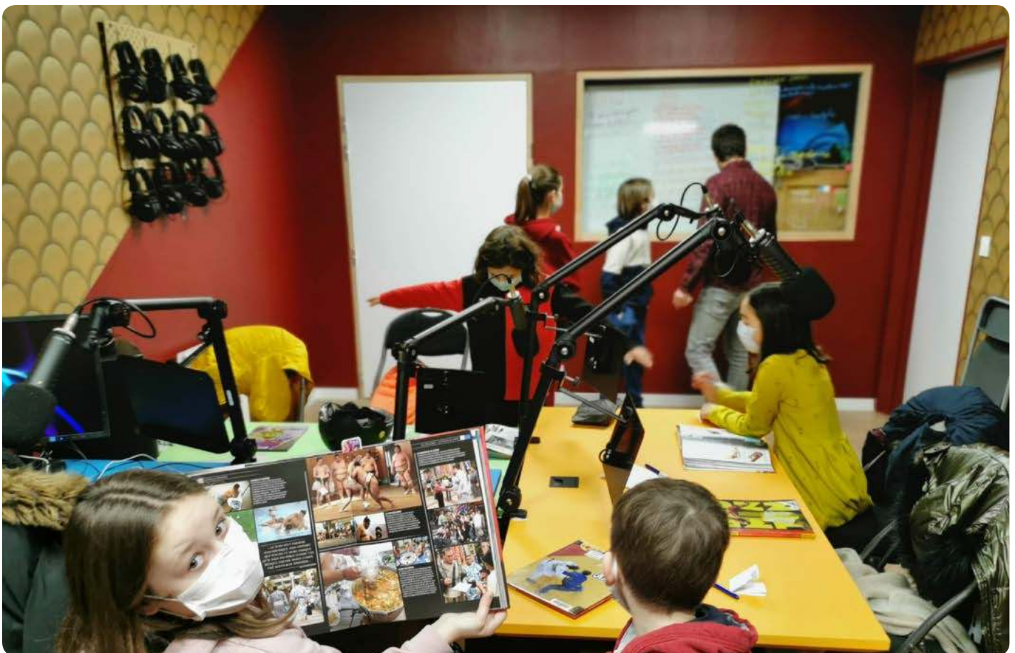
Le Studio de la Casba

Micros, enregistreur portable, table de mixage, ordinateur, enceintes, casques... le studio de la Casba est équipé pour enregistrer une émission de A à Z. Le mobilier est adapté à l'enregistrement avec des enfants. Nous disposons également d'un studio portable, ce qui renforce l'aspect tout-terrain de cette forme de création.